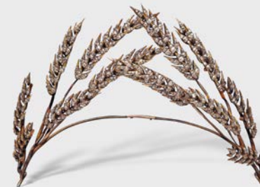
3 Ceres-Diadem 1. H. 19. Jh. Private Collection