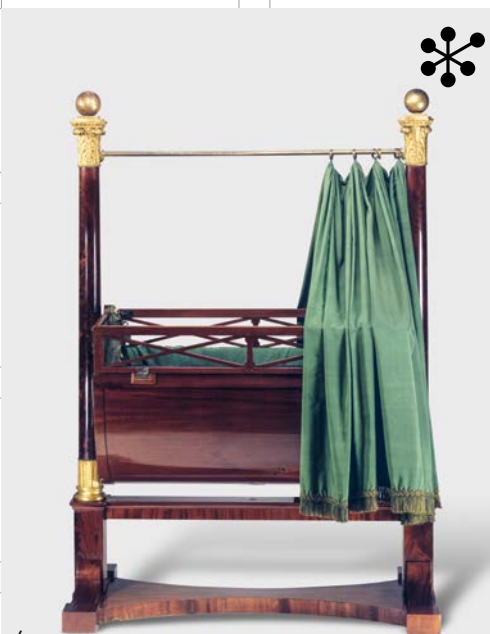
4 Wiege Vermutlich für eines der Kinder der Großherzogin Stephanie von Baden Karlsruhe, 1815-18 Badisches Landesmuseum Karlsruhe