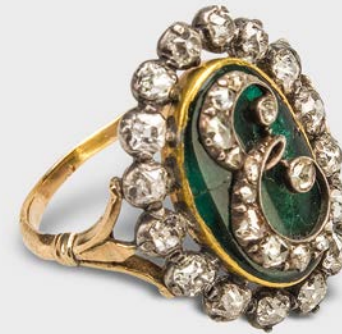
2 Diamantring von Eugène de Beauharnais Napoleonmuseum Thurgau, Schloss und Park Arenenberg

The jewellery of Napoleon's era was very different from that created before the French Revolution: it was more unobtrusive, but no less precious; rather, it was even more valuable. Its formal idiom was reminiscent of the Biedermeier style: delicate and, unlike the pompous Baroque jewellery, sleekly simple and finely crafted, gilded